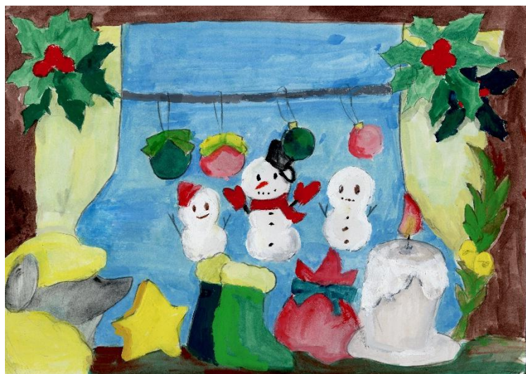
上：中1 Iさんの作品 下：中1 Wさんの作品