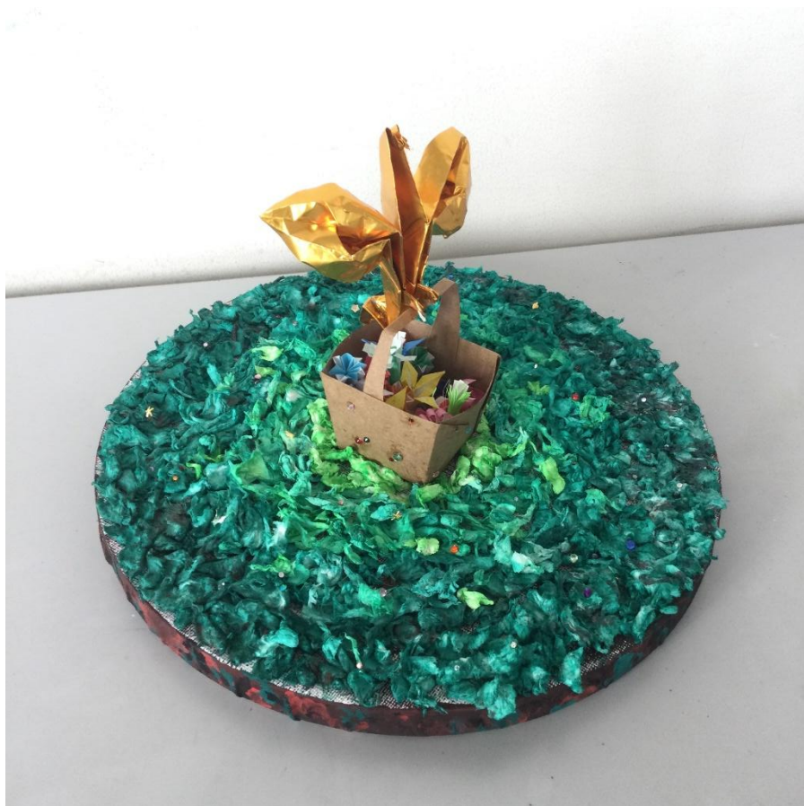
「贈り物」 S さんの作品