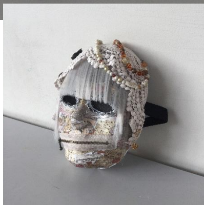
「美醜」 K さんの作品