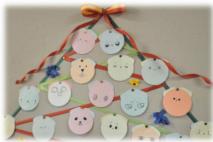
募金支援先の盲導犬を模したもの