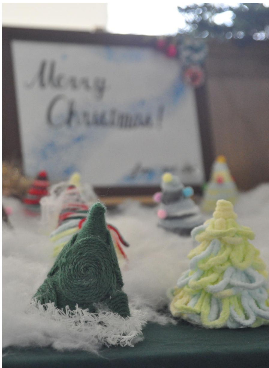
美術部が制作したミニツリーたち