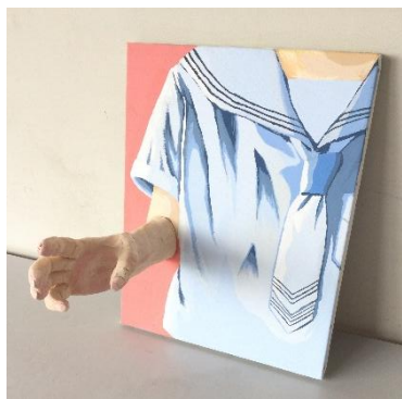
「握手」 H さんの作品