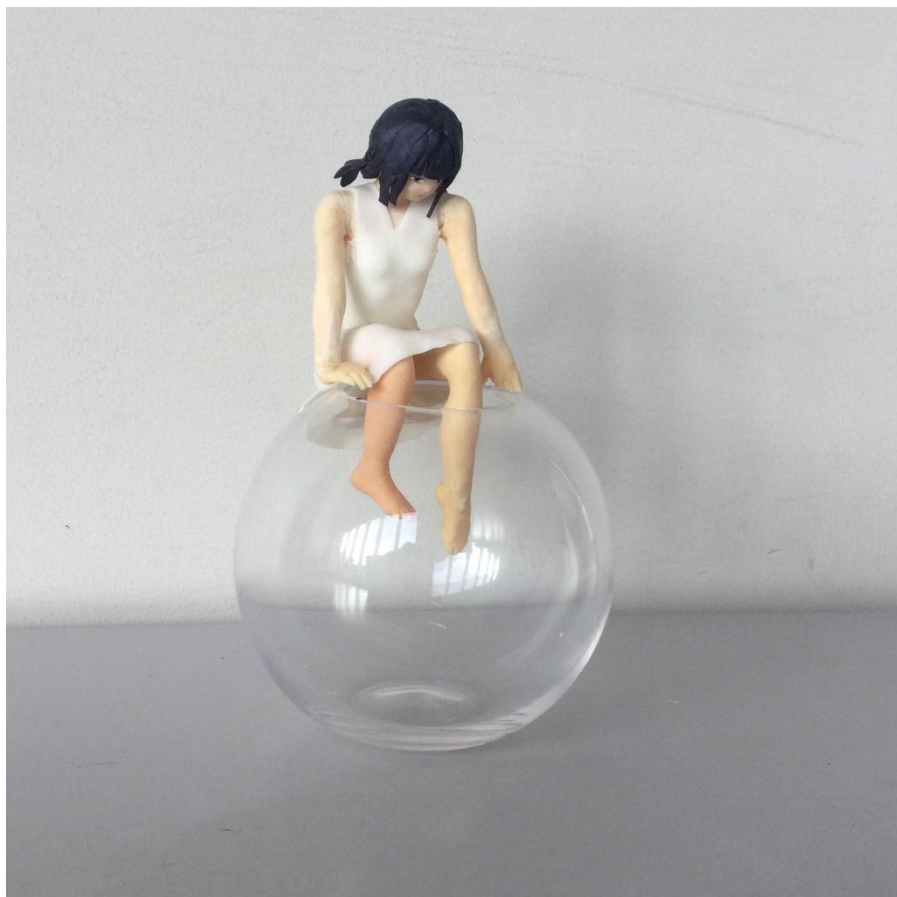
「女」 F さんの作品