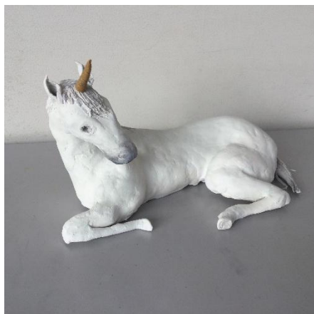
「ユニコーン」 Aさんの作品