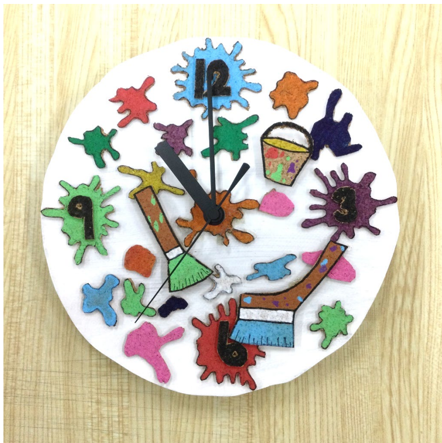
「ペンキ」 Fさんの作品