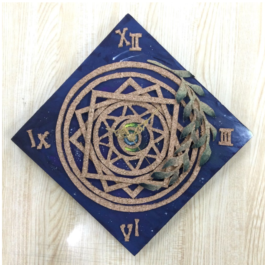
「魔法陣」 Oさんの作品