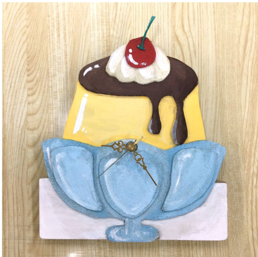
「プリン」 Ｙさんの作品