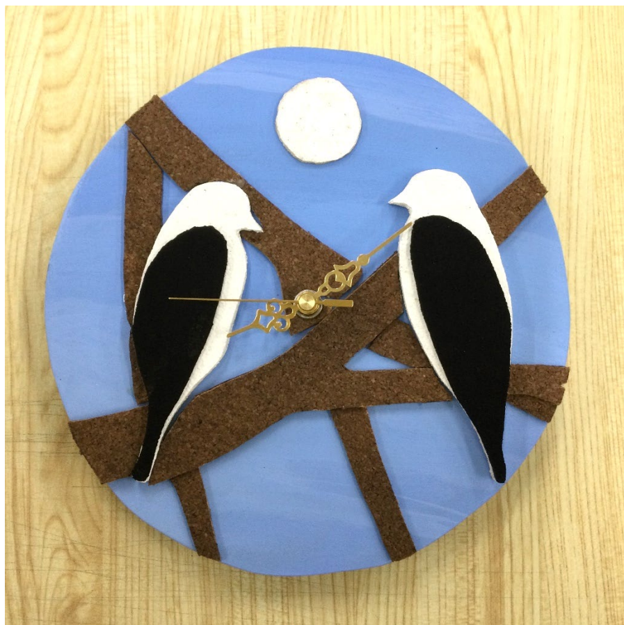
「森の鳥」 Wさんの作品