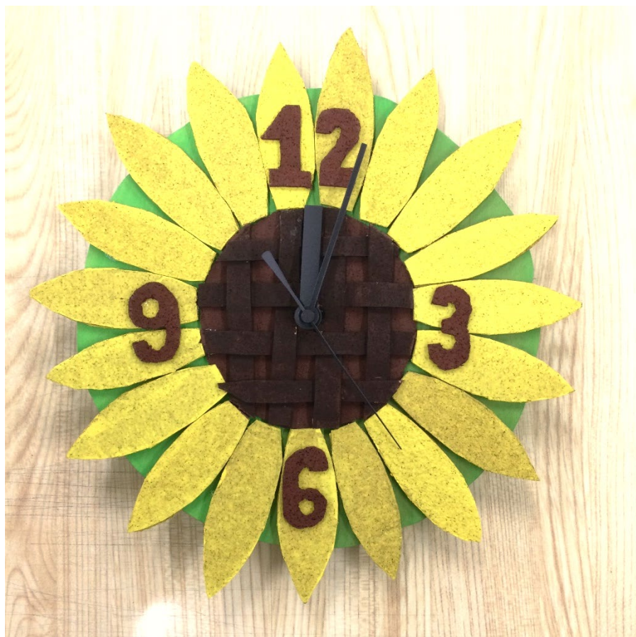
「ひまわり」 Kさんの作品