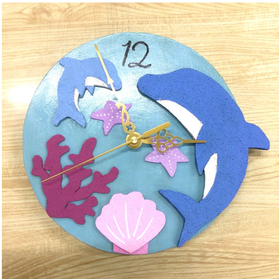
「海の中」 Mさんの作品